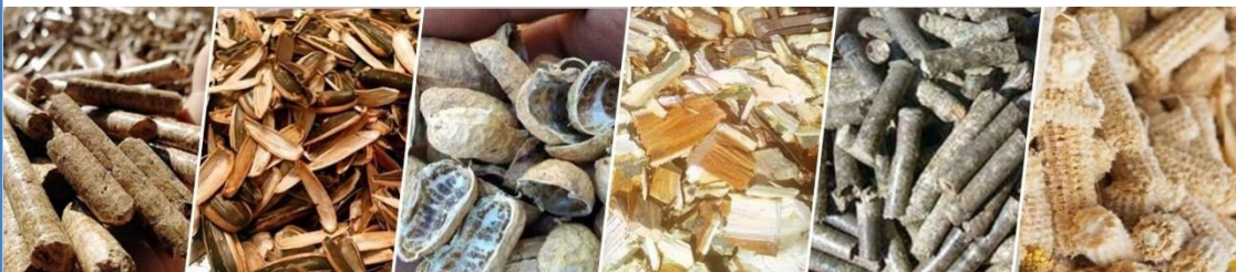
Rice Husk Pellets

La biomassa adatta alla lavorazione tramite digestione anaerobica a umido può essere costituita da tutti i tipi di letame agricolo di mucche, maiali, pollame, pecore, ecc.; mangimi di scarto, scarti di cereali, farina e crusca, scarti di macellazione, siero di latte, scarti vegetali, rifiuti alimentari, ecc. Dopo il processo di decomposizione anaerobica (senza ossigeno) della biomassa, il materiale residuo - un liquido denso contenente composti di azoto, fosforo e potassio (NPK) - può essere utilizzato direttamente come fertilizzante per il terreno o essere separato in fertilizzante secco e liquido per facilitarne lo stoccaggio e l'utilizzo.